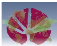
Figure 11 The future paradigm shift from green markets(GM) to sustainability markets(S) in the future green markets(GM) may need to clear social sustainability gaps for capitalisms to create wider sustainability markets(S).